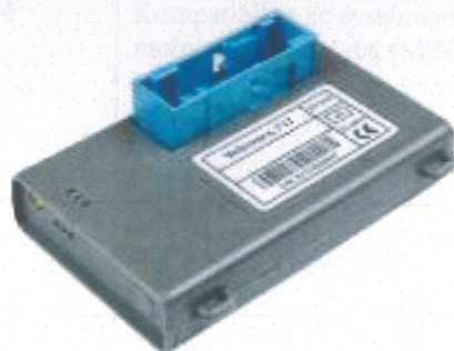
Vozidlová GPS Vectronics

Součástí dodávky je 5-letá záruční lhůta v rámci servisního programu Motorola Bronze, který pokrývá i náklady oprav (s výjimkou mechanických poškození nevhodným používáním – pád, náraz do displeje atp.).