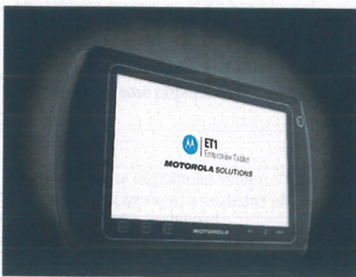
tablet Motorola ET1